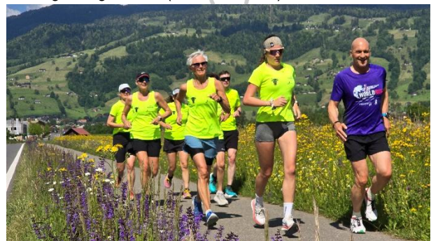
Sontagsmorgen Run (Halbmarathon)