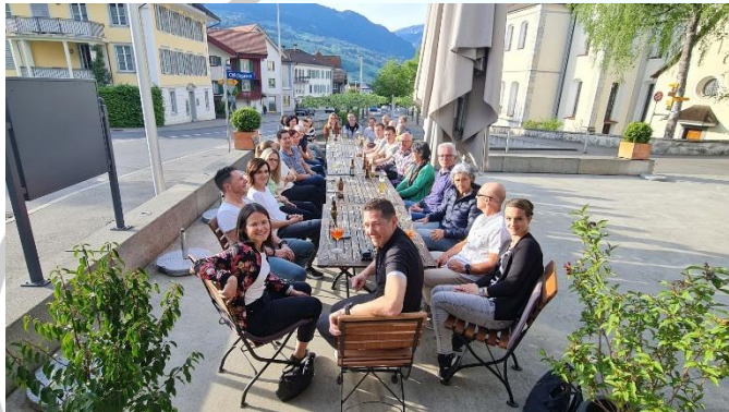
...Einem gediegenen Apero vor dem Nachtessen