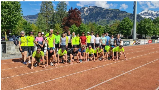
Samstagnachmittag Intervall auf der Bahn in Sarnen