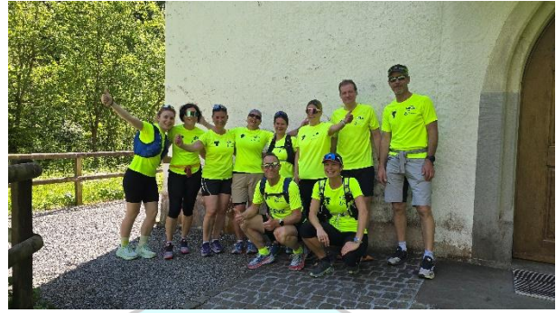
Flüeli Ranft, bei Bruder Chlaus