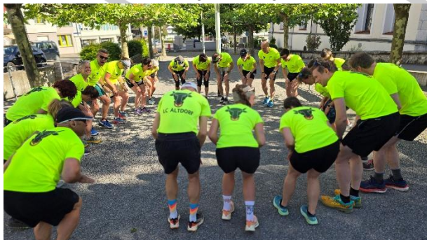
Warmup vor dem Samstag-vormittags Run