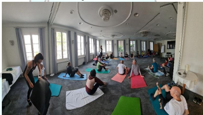
Mit anschliessender Yoga-Session